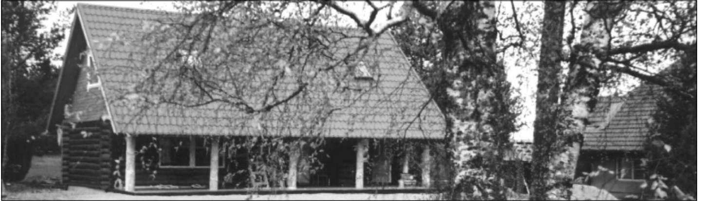
■ Aravuse palkmaja, kus EKLiit ühte pöördelist koosolekut pidas. Ajalugu tunneb teisigi poliitiliselt olulisi rajatisi: Võisilma talu, Hundisilma talu...