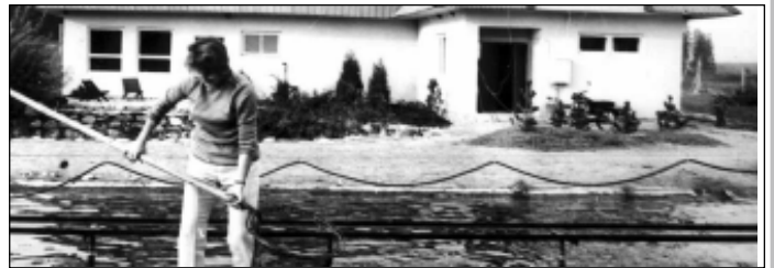
■ Oli aasta 1975, Aravusel.